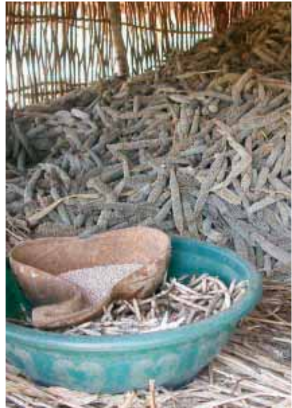
Une bonne récolte de millet. Le journal paysan transmet de nouvelles connaissances aux petits paysans du Kenya. Ils peuvent ainsi augmenter leurs rendements.