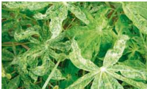
Plante de manioc malade avec les marques typiques de la mosaïque.