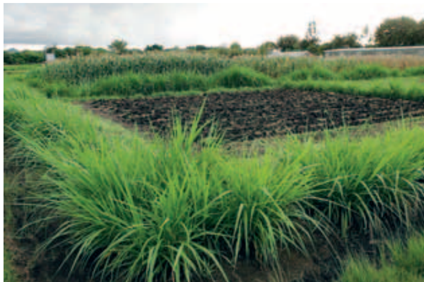
Champ PushPull fraîchement semencé et entouré d'une haie d'herbe à éléphant.

PushPull – pousser-tirer – est un principe de base dans la lutte biologique contre les parasites. On utilise des matières naturelles comme des odeurs de plantes ou des couleurs pour chasser ou attirer les parasites. Le Dr Zeyaur Khan, chercheur de l'Institut international de recherche sur les insectes (icipe) à la station de recherche de Mbita Point au lac Victoria, a développé une méthode PushPull efficace contre la pyrale. L'odeur du desmodium, qu'on plante entre les rangs de maïs, chasse le papillon à l'extérieur du champ... où on a planté de l'herbe à éléphant dont les feuilles collantes ont un parfum qui attire irrésistiblement la pyrale. Elle y meurt immobilisée. On protège ainsi le maïs sans manipulations génétiques, sans produits chimiques et sans nuisance pour l'environnement. En plus, l'herbe à éléphant et le Desmodium sont de bonnes plantes fourragères, riches en substances nutritives. Du même coup, elles apportent de meilleures récoltes, mais aussi de la nourriture pour les vaches et les chèvres, et donc une production de lait. Les agriculteurs peuvent ainsi gagner et épargner de l'argent.