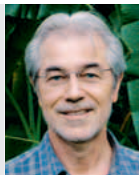
Dr Hans Rudolf Herren

Pour diffuser la méthode PushPull il est crucial de gagner la confiance des agricultrices. C'est pourquoi il vaut mieux avoir des enseignantes. Avec notre intuition et notre enthousiasme – et entre femmes – le courant passe mieux ! ”