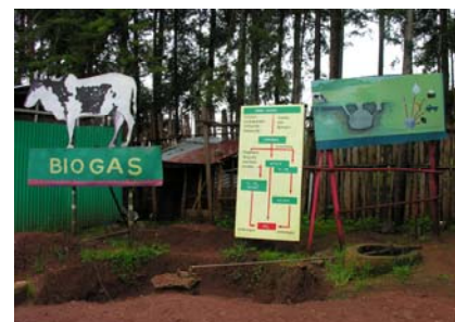
Des cours pratiques proposent de manière claire un savoir sur les nouvelles méthodes agricoles biologiques comme le biogaz.