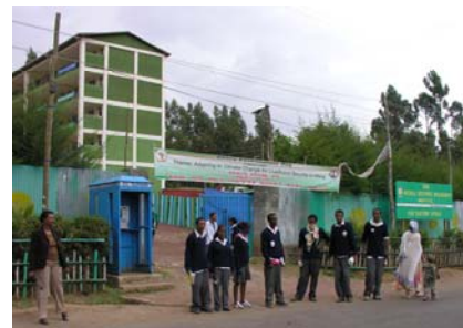
Etudiants en agriculture devant l'Institut YEHA à Addis Abeba.