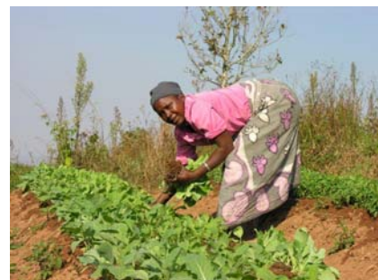
Près de 80% de la population travaille dans l'agriculture et manque de formation et de connaissances.