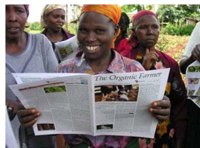
Paysannes et paysans reçoivent dans The Organic Farmer des conseils pratiques leur permettant de s'aider eux-mêmes.