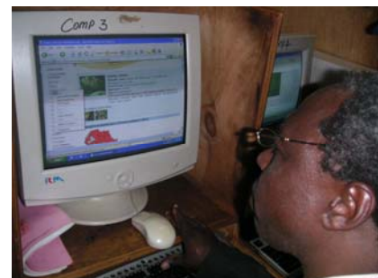
Sur Infonet, les utilisateurs apprennent vite à trouver les informations qui les intéressent.