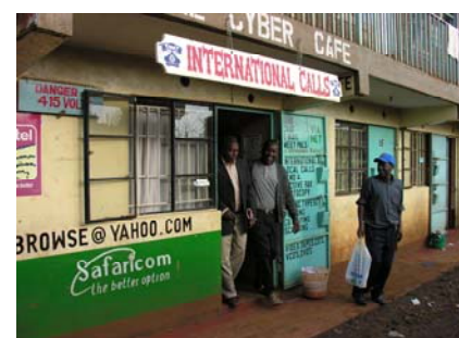
Grâce à l'apparition de nombreux cafés Internet, l'accès à l'information est facilité.