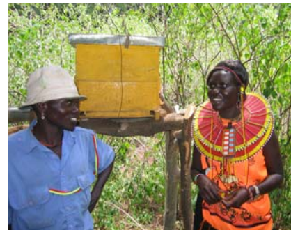
De nouvelles ruches améliorent la production et la qualité du miel.