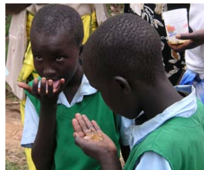
Le miel est très apprécié et utilisé en Afrique pour la prévention des maladies.