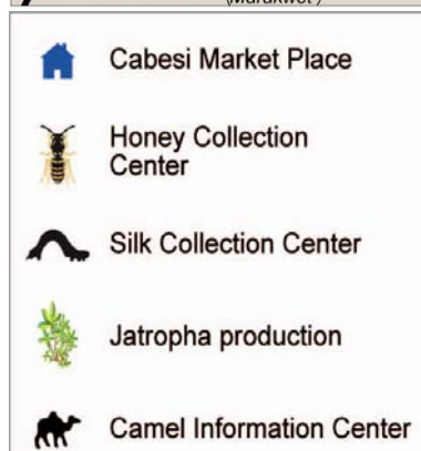
Les projets dans la région du Pokot Ouest.

Six organisations de base qui exploitent les points de collecte des produits de l'apiculture ainsi que deux organisations de base locales spécialisées sur la production de soie sauvage; apiculteurs; producteurs de soie sauvage; éleveurs de chameaux; communauté d'intérêt pour les essais de Jatropha curcas; écoles secondaires organisant des Cabesi-Clubs (production de miel et prévention du paludisme)