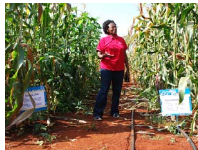
Des essais en pleine terre doivent montrer l'influence des différentes méthodes de culture sur les rendements.