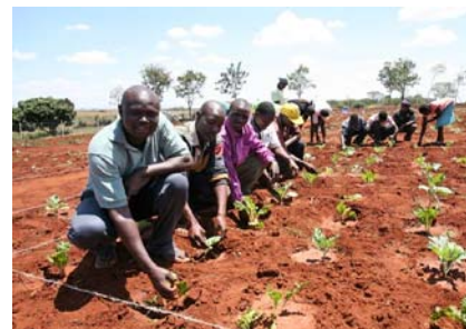
Les connaissances acquises sont transmises directement à des conseillers agricoles et à des paysans-nes.