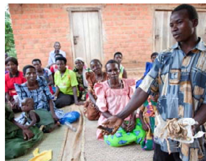
Les gens sont informés sur l'efficacité des plantes aromatiques et médicinales. En même temps, ils sont sensibilisés à la valeur des forêts.