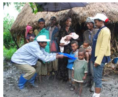
Les enfants sont particulièrement en danger. C'est pourquoi on distribue des moustiquaires en priorité aux familles ayant de jeunes enfants.