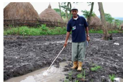
Les eaux stagnantes sont une menace. Elles sont le lieu de ponte idéal pour les moustiques porteurs du paludisme.