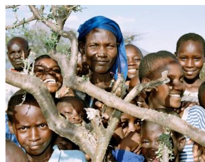
Le projet génère de nouvelles sources de revenu dans la région et permet aux familles d'envoyer leurs enfants à l'école.