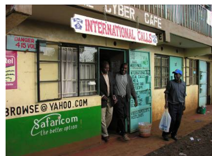
Grâce à l'apparition de nombreux cafés Internet, l'accès à l'information est facilité.