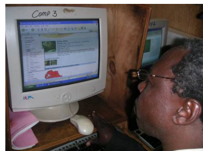
Sur Infonet, les utilisateurs apprennent vite à trouver les informations qui les intéressent.