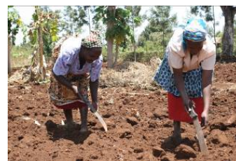
Biovision encourage l'agriculture durable auprès des petits paysans.

La république du Kenya dispose de différentes zones climatiques qui vont du Sud-Est tropical au Nord sec, en passant par le Sud-Ouest montagneux, avec le deuxième sommet d'Afrique, le Mont Kenya. La fertilité des sols est variable en fonction des régions. Le plateau du Great Rift Valley dans l'Ouest du pays est très fertile. Mais ce ne sont que 20% de la surface du pays qui sont cultivables. Plus de 75% des Kenyans sont actifs dans l'agriculture et produisent environ 24% du produit intérieur brut. La majorité des agriculteurs sont des petits paysans cultivant des parcelles de moins de 2 hectares. La surexploitation des terres fertiles est un grand danger pour l'avenir de l'agriculture et la sécurité alimentaire du Kenya.