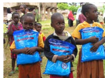
Projets de lutte contre la malaria au Kenya.