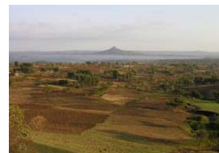
Seule une petite partie du sol fertile est exploitée.