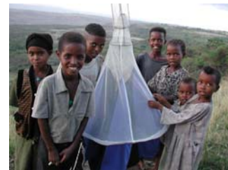
Lutte efficace contre la mouche tsé-tsé avec des pièges colorés et parfumés écologiques dans le cadre du projet à Assosa.