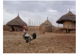
Le manque d’eau, les sécheresses et des méthodes agricoles archaïques rendent la situation alimentaire difficile.

L’agriculture tient un rôle central dans l’économie éthiopienne. Plus de 80% de la population est active dans ce secteur. Il s’agit principalement d’une agriculture de subsistance, c’est-à-dire que les cultures et l’élevage sont pratiqués principalement pour répondre aux besoins des agriculteurs. Alors que presque 70% de la superficie du pays sont cultivables, seuls 11% sont exploités. A côté de l’agriculture de subsistance, c’est surtout du café qui est produit pour l’exportation. Une distribution d’eau insuffisante (seuls 22% de la population à accès à l’eau potable), la surexploitation des sols et des méthodes agricoles archaïques détruisent la fertilité des sols et créent un danger de désertification.