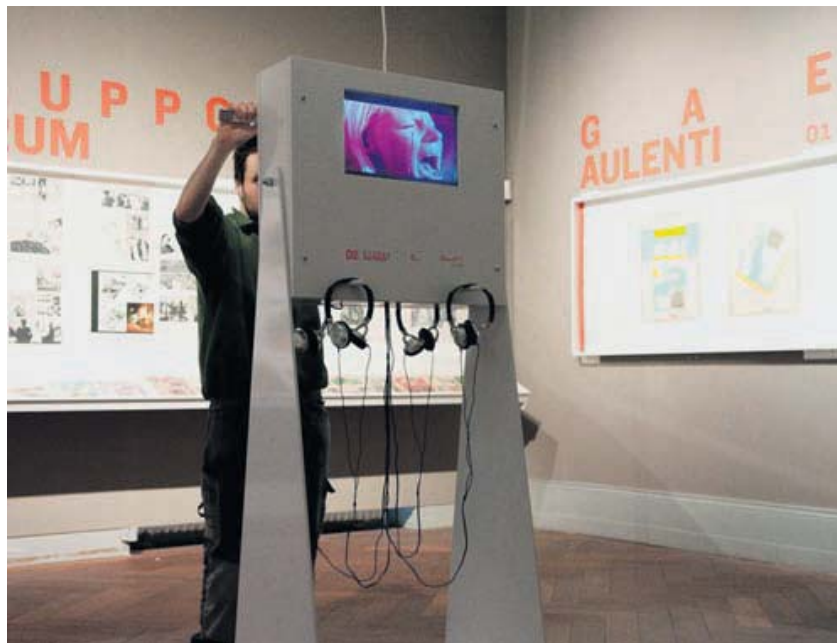
Designgeschichte. Fotos und Filme geben Einblick in die italienische Designrevolution der 60er- und 70er-Jahre.

Dass Paul McCreech bei all dem die federführende Figur war, zeigte sich nicht erst bei Dvoráks siebter Sinfonie. Doch auch hier durchzog ein faszinierend tänzerischer, herrlich leichter Zugriff das gesamte, sehr transparent gestaltete Werk. Man spürte, dass dieser Dirigent in der Alten Musik gross geworden ist, denn dort weiss man um die Wurzeln der Musik im Tanz. McCreech konnte sie sogar im romantischen Repertoire hörbar machen.