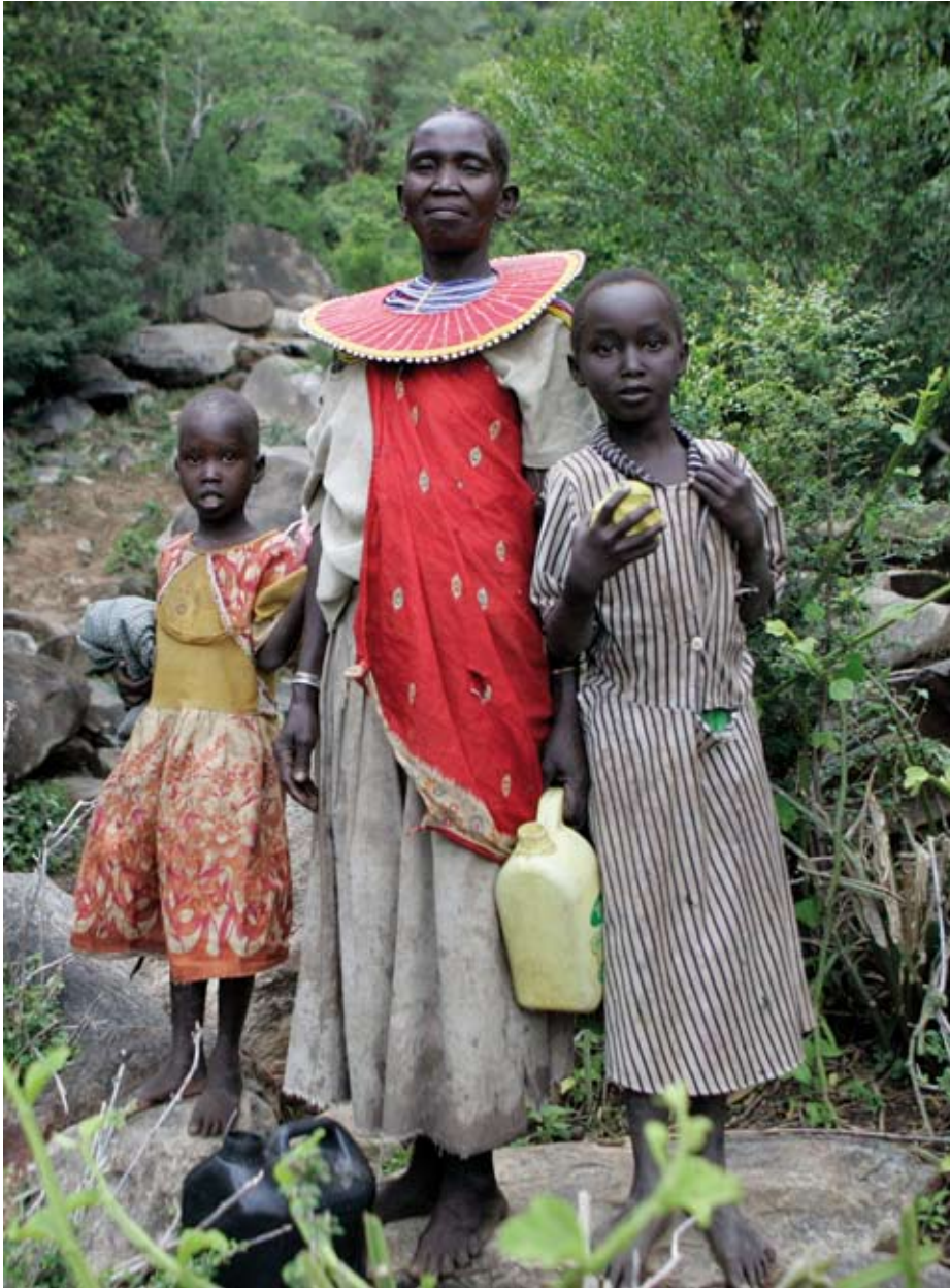
Frauenförderung: Im Projekt Cabesi werden die West Pokot-Frauen aktiv in die Arbeit und die Entscheidungsfindung einbezogen. Das stärkt ihr Selbstvertrauen und ihre Stellung in der bisher von Männern dominierten Gesellschaft.