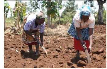
Biovision unterstützt nachhaltige Landwirtschaft für Kleinbäuerinnen und Kleinbauern

Die Republik Kenia verfügt über verschiedenste Klimazonen. Vom tropischen Südosten über den gebirgigen Südwesten – mit Afrikas zweithöchstem Gipfel, dem Mount Kenia - bis zum trockenen Norden. Die Fruchtbarkeit der Böden ist je nach Region unterschiedlich. Speziell fruchtbar gilt das Great Rift Valley Plateau im Westen des Landes. Insgesamt sind jedoch nur ca. 20% des Landes landwirtschaftlich nutzbar. Über 75% der Kenianerinnen und Kenianer sind in der Landwirtschaft tätig und erarbeiten dort ca. 24% des Bruttoinlandproduktes. In Kenias Landwirtschaft sind die grosse Mehrheit der Beschäftigten Kleinbäuerinnen und Kleinbauern mit weniger als zwei Hektaren Land. Die starke Übernutzung der fruchtbaren Böden stellt ein grosses Risiko dar für die Zukunft der Landwirtschaft und für die Nahrungssicherheit in Kenia dar.