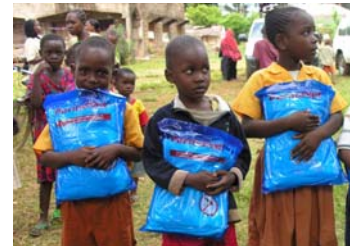
Malariabekämpfungsprojekte in Kenia