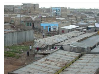
Über 70% der Bewohnerinnen und Bewohner von Städten wohnen in Slums.

Kenia gilt innenpolitisch als eher stabil, v.a. im Vergleich mit einigen seiner Nachbarländer. Der massive Wahlbetrug in den Präsidentschaftswahlen von 2007 führte jedoch zu schweren Ausschreitungen. Seit dem 2008 eine Koalitionsregierung gebildet wurde, hat sich die Lage grösstenteils beruhigt.