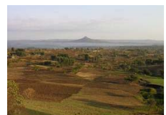
Nur ein kleiner Teil des fruchtbaren Bodens wird genutzt

Obschon der Vielvölkerstaat über weit zurückreichende historische Wurzeln verfügt, fehlt bis heute eine einheitliche Identifizierung der Bewohner mit ihrem Land. Das Verständnis, wofür Äthiopien genau steht, ist je nach Ethnie sehr unterschiedlich.