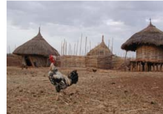
Fehlender Zugang zu Wasser, Dürreperioden und veraltete Anbaumethoden verschlechtern die Nahrungssituation im Land.

Die Landwirtschaft nimmt eine zentrale Rolle in der Äthiopischen Wirtschaft ein. Über 80% der Bevölkerung ist in diesem Sektor beschäftigt. Subsistenzwirtschaft herrscht vor, das heisst Ackerbau und Viehwirtschaft werden vorwiegend für den Eigenbedarf betrieben. Obwohl fast 70% der Landesfläche landwirtschaftlich nutzbar wäre, werden nur etwa 11% bebaut. Neben der Subsistenzwirtschaft wird v.a. Kaffee zum Export angebaut. Die mangelnde Wasserversorgung - nur gerade 22% der Bevölkerung haben Zugang zu sauberem Wasser, Übernutzung des Landes und veraltete Anbaumethoden führen weiter zu einer Verschlechterung der Bodenfruchtbarkeit und bringen das Risiko der Desertifikation mit sich.