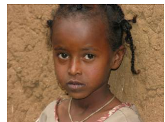
Fast die Hälfte der Bewohnerinnen und Bewohner Äthiopiens ist unter 14 Jahre alt.

Äthiopien ist mit seinen 2'000 Jahren das älteste Kulturland Afrikas. Gleichzeitig gehört die durch innere Unruhen, den in der Sezession Eritreas mündenden Bürgerkrieg und Hungersnöte gebeutelte Republik zu den ärmsten Ländern der Welt. So belegt das Land sowohl in Punkto kaufkraftbereinigtem Pro-Kopf-Einkommen (900$ / Jahr) als auch auf dem Human Development Index (0.41 / 1 Punkte) der UNO einen der hintersten Ränge. Über drei Viertel aller Bewohnerinnen und Bewohner Äthiopiens leben mit weniger als 2 US Dollar pro Tag, 99.4% der städtischen Bevölkerung lebt in Slums und Infektionskrankheiten sind weit verbreitet. Beispielsweise sind 4.4% der Bevölkerung mit HIV/Aids infiziert. Die Tropenkrankheit Malaria ist für rund 27% aller Todesfälle in Krankenhäusern verantwortlich. Neben der schlechten gesundheitlichen Versorgung, stellen auch der sehr stark eingeschränkte Zugang zu Wasser, die wiederkehrenden Dürren, das grosse Bevölkerungswachstum und die politischen Spannungen entwicklungshemmende Faktoren dar.