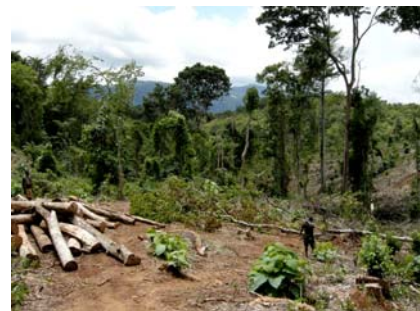
Wald-unabhängiges Einkommen zu schaffen hilft den enormen Druck auf die artenreichen Wälder zu verringern.