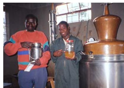
Der auf den Höfen angebaute Kilimandscharo-Basilikum ( Ocimum kilimadscharicum ) wird in einer Anlage destilliert. Die Pflanzenextrakte werden zu Heilmitteln weiterverarbeitet.