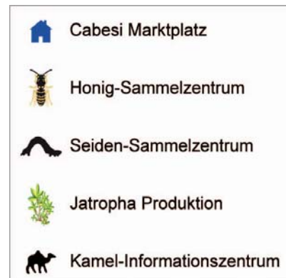
Projektorte in und um West Pokot.