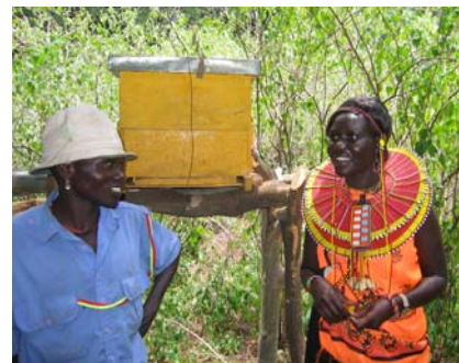
Neue Bienenkästen verbessern den Ertrag und die Qualität des Honigs.