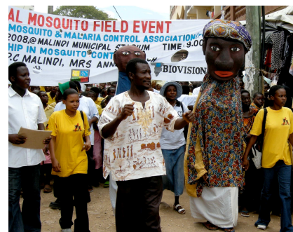
An Malaria-Informationstagen wird die Bevölkerung auf das Problem der Malaria übertragenden Mücken aufmerksam gemacht.