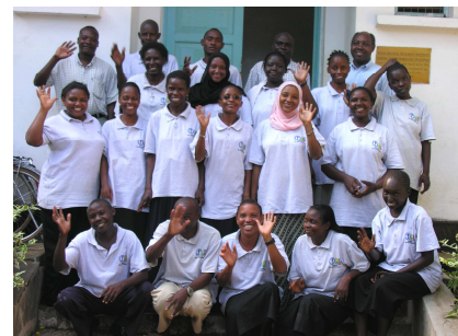
Mosquito-Scouts“ (Moskito-SpäherInnen, ausgebildete Laien) stellen die aktive Beteiligung der Bevölkerung für eine nachhaltige Bekämpfung der Malaria sicher.