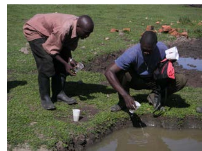
Stehendes Wasser ist ein ideales Brutgebiet für Malariamücken.