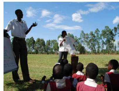
Schülerinnen und Schüler werden in Nyabondo über den Zusammenhang zwischen Mücken und Malaria aufgeklärt.