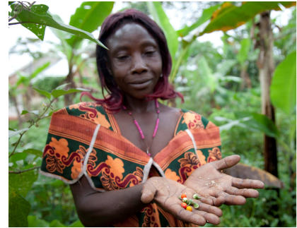
Heilpflanzenprodukte aus der traditionellen Medizin werden auf ihre Wirksamkeit untersucht. Die traditionellen HeilerInnen werden ausgebildet, um ausgewählte pflanzliche Arzneimittel von hoher Qualität lokal herzustellen und so ein Einkommen zu generieren.

Biovision - Stiftung für ökologische Entwicklung Schaffhauserstr. 18 CH-8006 Zürich Tel. +41 44 341 97 18 Fax +41 44 341 97 62 info@biovision.ch www.biovision.ch PC-Konto: 87-193093-4