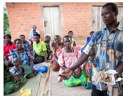
Die Menschen werden über Wirksamkeit verschiedener Aroma- und Heilpflanzen informiert und dadurch für den Wert der Wälder sensibilisiert.

Programmverantwortung: Verena Albertin, Biovision