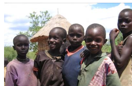
Das Projekt generiert neue, nachhaltige Einkommensquellen in der Region und ermöglicht so Familien, das Schulgeld für ihre Kinder zu bezahlen.