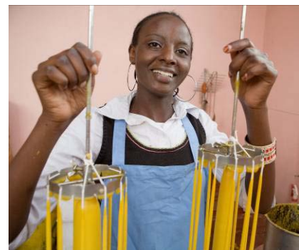
Das Wachs, welches früher als Abfallprodukt der Honigverarbeitung galt, wird heute im „Cabesi Market Place“ zu Kerzen weiterverarbeitet.