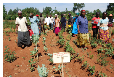
Die iTOF-Berater/innen gehen in die Dörfer und führen die Trainings für Bauerngruppen direkt vor Ort durch. Dieses Angebot wird überaus geschätzt, was die starke Nachfrage zeigt.