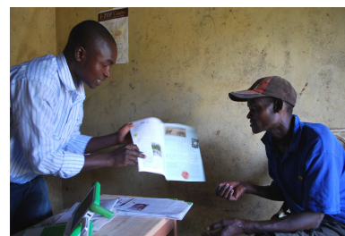
In einem iTOF Zentrum erhält ein Kleinbauer Informationen über nachhaltige Landwirtschaftsmethoden. Auf seine offenen Fragen findet er im Informationszentrum eine Antwort.